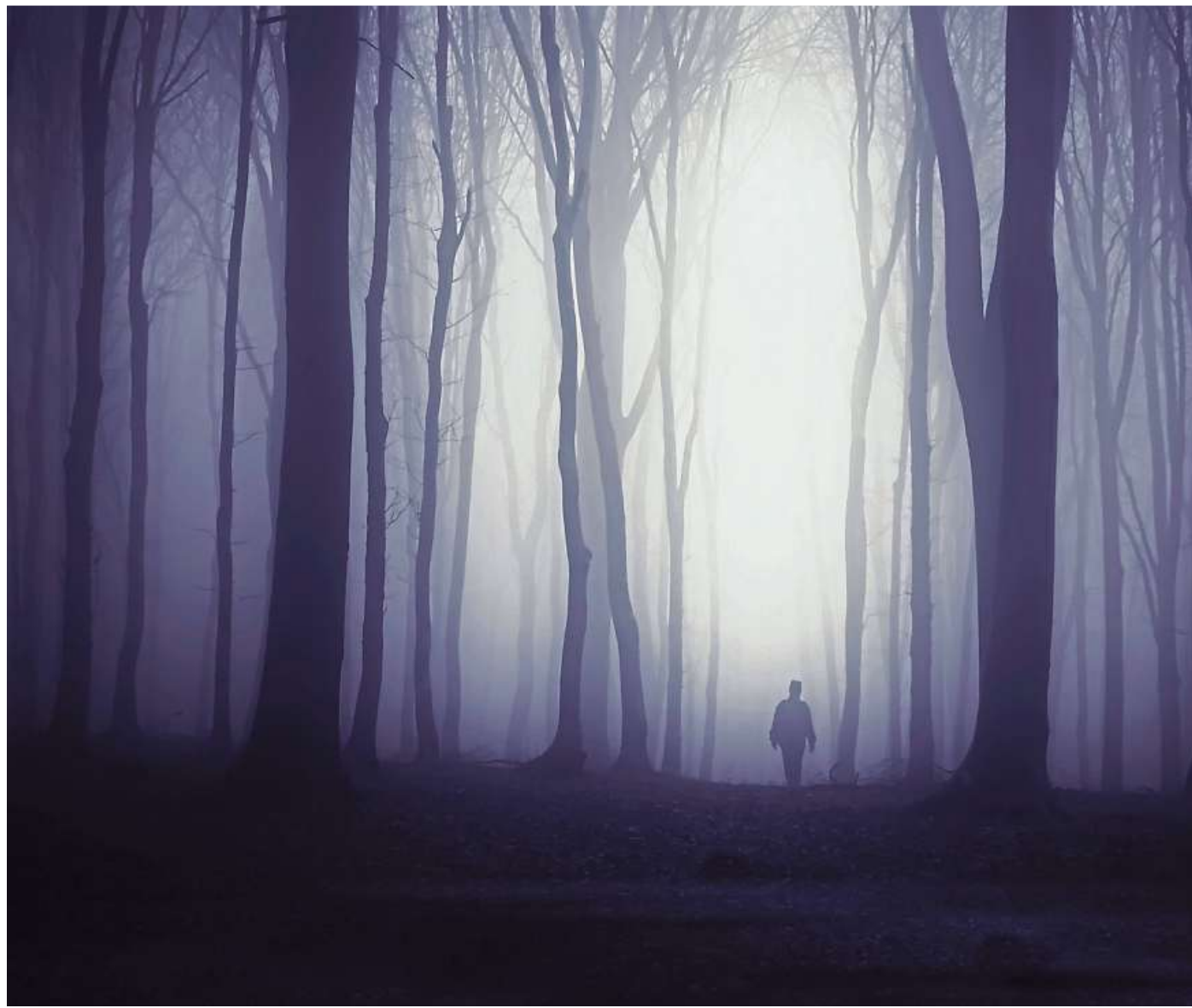
Treten Alpträume häufig auf, können sie die Betroffenen auch tagsüber belasten