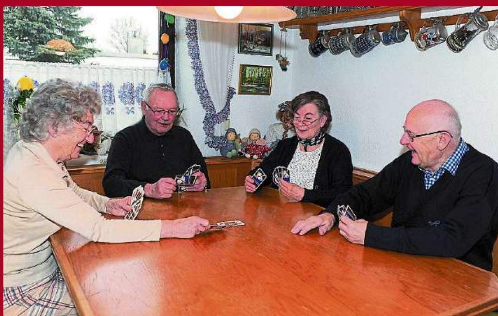
Betreutes Wohnen in der WG finden viele Senioren ansprechend.

Es ist kein Wunder, dass sich mittlerweile mehr und mehr ältere Leute eine Wohnung teilen und dabei auch noch von einer Pflegekraft betreut werden. Die Vorteile liegen dabei klar auf der Hand – die wenigsten Menschen wollen in fortgeschrittenem Alter ganz allein leben, doch das Seniorenheim ist für viele keine besonders verlockende Alternative. In der Wohngemeinschaft mit Altersgenossen hat man Anschluss, kann sich selbst versorgen und hat dennoch immer eine helfende Hand zur Seite, wenn man mal Unterstützung benötigt. Lange weile oder Einsamkeit haben da also keine Chance, kann man sich doch bei Spieleabenden miteinander die Zeit vertreiben, in fröhlicher Runde kochen oder