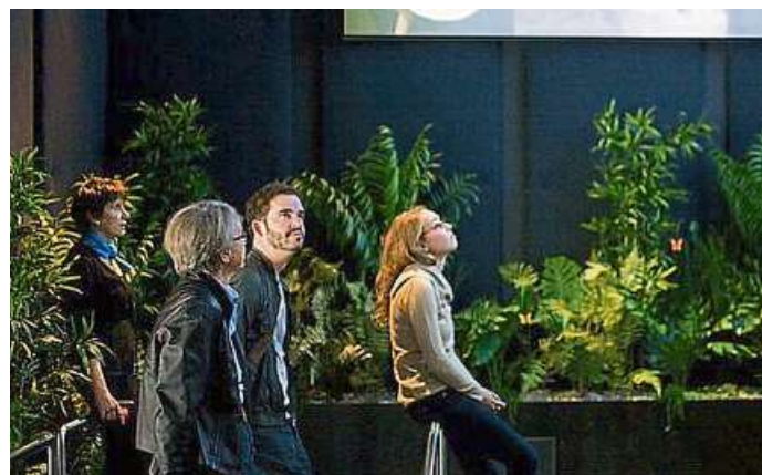
Besucher testen in der Ausstellung ihr Entscheidungsverhalten.

Koch oder Künstler? Anna oder Lena? Kind oder Karriere? Oder am liebsten beides? Bis zu 20.000 Entscheidungen trifft ein Mensch täglich. Auf dem Rundgang durch diesen Supermarkt der Möglichkeiten, den die rund 900 Quadratmeter große Ausstellung bietet, setzen sich die Besucher mit Fragen aus verschiedenen Lebensbereichen auseinander und unternehmen Ausflüge in die Welt der Job-Hopper, Fast-Liebpaare oder Nichtwähler. So berichten Jugendliche beispielsweise über ihre Berufswahl, Bürger debattieren über ihren politischen Entscheidungsspielraum und Paare erzählen, was sie in unverbindlichen Zeiten zusammenhält.