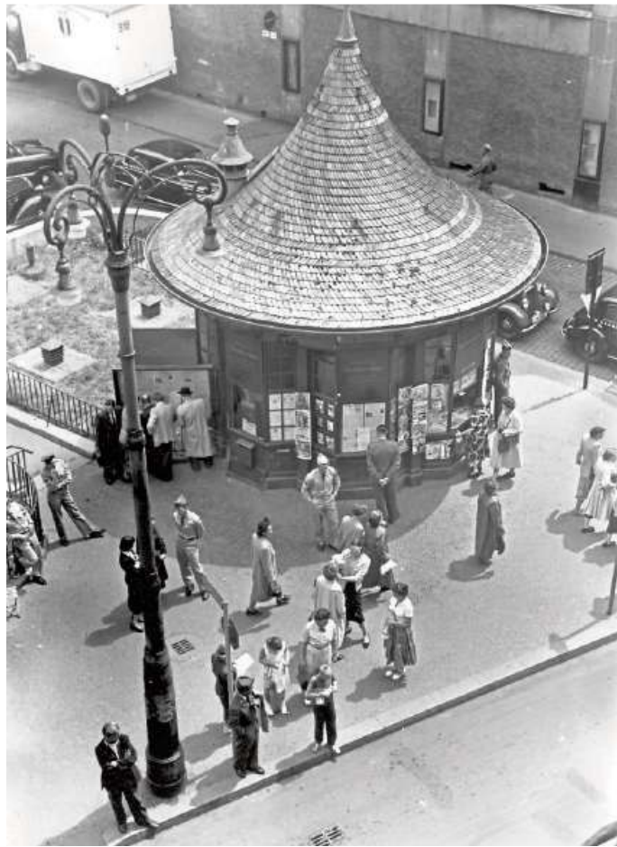
Auch die Geschichte der Wiesbadener Wasserhäuschen könnte ein Thema sein: Diese Aufnahme aus dem Jahr 1952 zeigt Soldaten und Zivilisten am Kiosk auf dem Mauritiusplatz.

Unter dem Motto „Bürger schreib‘ Geschichte“ können sie sich mit ihrer Idee ab sofort anmelden. Einsendeschluss für die komplette Bewerbung ist dann der 15. Februar. 15 Laienhistoriker werden von einer Experten-Jury unter allen Bewerbern ausgewählt und können sich zwischen März 2016 und August 2017 18 Monate lang einem stadtgeschichtlichen Thema ihrer Wahl widmen. Ihre Themen suchen sie sich selbst aus. So können sie zum Beispiel die Geschichte einer Persönlichkeit, einer Straße, eines Stadtteils, eines Unternehmens, eines Industriezweiges oder einer kulturellen Einrichtung in den Mittelpunkt ihrer Forschungen stellen. Ein Thema könnten die alten Wasserhäuschen oder die alten Wiesbadener Kinos sein, nennt Projektkoordinator Elmar Ferger, der gemeinsam mit Prof. Dr. Klaus Eiler (Historische Kommission für Nassau) die StadtteilHistoriker fachlich und pädagogisch betreuen wird, zwei Beispiele. Eine Aufarbeitung der Wiesbadener Industriegeschichte dagegen kann sich Schirmherr Heinrich Albert, letzter lebender Enkel der Dynastie Albert, als Thema gut vorstellen. Dr. Bernd