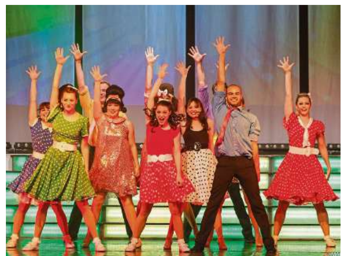
Das Publikum kann sich auf ein Ensemble aus internationalen Top-Solisten freuen, das von Tänzern aus dem Londoner East End unterstützt wird.

Die Show Starnights an Silvester in Frankfurt