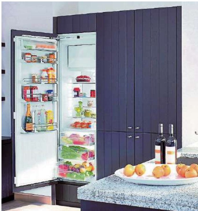
Moderne Kühlschränke mit hoher Energieeffizienzklasse helfen, Strom zu sparen.

Die Energieeffizienzklasse A+++ ist bei Kühl- und Gefrierschränken nicht der Standard, es gibt noch viele Geräte mit A++. Der Energieverbrauch hängt aber auch von der Größe des Gerätes ab. So kann ein kleineres Gerät mit A++ unter Umständen weniger Strom verbrauchen als ein großes Gerät mit A+++.