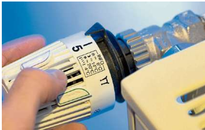
Der Einbau von Thermostaten oder ein hydraulischer Abgleich der Heizung sind Möglichkeiten, Heizenergie zu sparen.

Mehrmals täglich stoßlüften – im Winter fünf bis zehn Minuten –