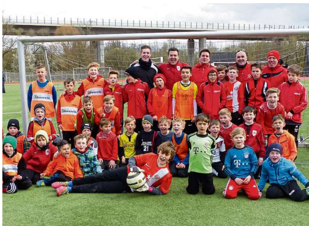
Der Spaß ist den jungen Kickern anzusehen: Auf dem Sportgelände der Spvgg. Eltville gab es schon viele Ferien camps. Jetzt veranstaltet das Fußballportal FuPa.Net in den Herbstferien erstmals ein solches Trainingslager.