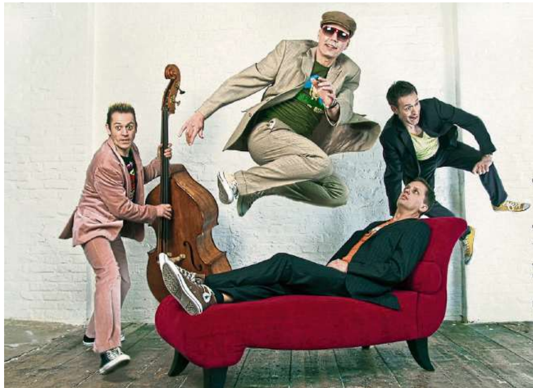
Energiegeladenes Quartett mit „Abs & Auf's“.

Superfro kommen mit neuem Programm „down & up“