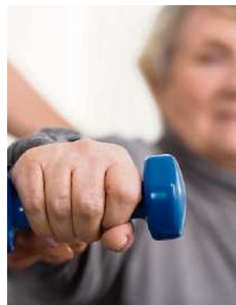
Ein Krafttraining kann bei Krebspatienten die auftretende Müdigkeit mindern.

die unter 160 Brustkrebspatientinnen. Diejenigen Teilnehmerinnen, die parallel zu ihrer Strahlentherapie Muskeltraining betrieben, waren signifikant weniger erschöpft als jene, die Entspannungsübungen absolvierten. In einer weiteren Studie absolvierten Krebspatienten, die bereits unter Tumorkachexie litten, ein gesundheitliches Krafttraining und konnten erstaunliche Erfolge erzielen. Neben einer Gewichtszunahme konnten sie ihre Muskelkraft innerhalb von acht Wochen um bis zu 20 Prozent steigern. Die Analyse ihrer Blutwerte zeigte zudem, dass die Aktivität der Killerzellen und somit die Abwehr gegen Krebszellen gesteigert sowie eine bessere Ausdauerleistung erzielt werden konnte. Ein regelrechter Paradigmenwechsel könnte damit in der Behandlung von Krebspatienten anstelle von der ärztlichen Empfehlung zu „Absoluter Ruhe und